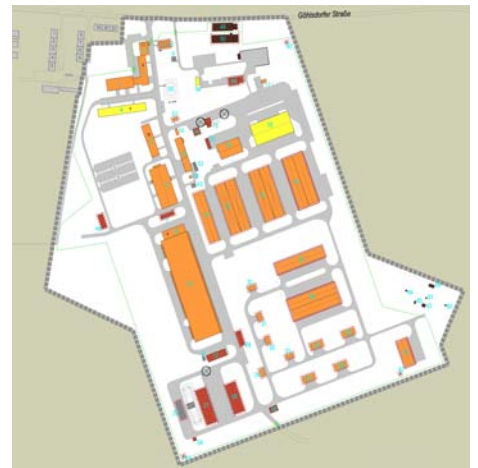
1-4 Vor Ort, Nachnutzung vs. Renaturierung 5 Ausschnitt Stufenkonzept 6 Anbindepunkte, Nachbarn, Restriktionen 7 Substanzbewertung 8-10 Erschließungsoptionen